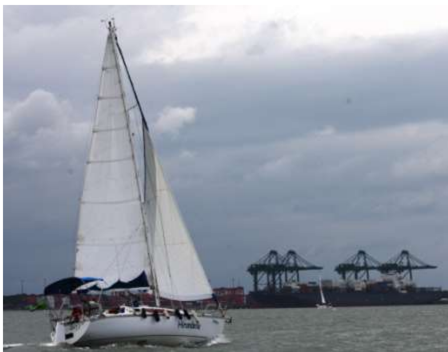
Veleiro Hirondele, classe Bico de Proa.

O objetivo da criação da classe Bico de Proa foi plenamente alcançado, com a participação de 4 barcos nesta classe, sendo os barcos participantes o Prósper; Hirondele, Moleque e o Comparsa.